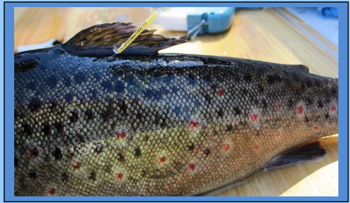
ankkurimerkillä merkitty taimen