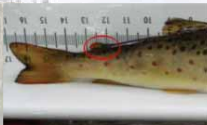
Rasvaevällinen taimen (luonnonkala)