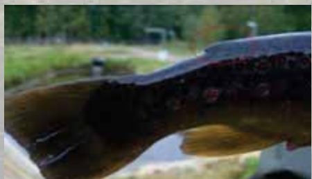
Eväleikattu taimen (istukas)

Vuoden 2016 alusta on rasvaevällinen taimen kalastusasetuksella rauhoitettu leveyspiiriin 64 eteläpuolella. Sääntö koskee siis myös Päijänteen vesistöä.