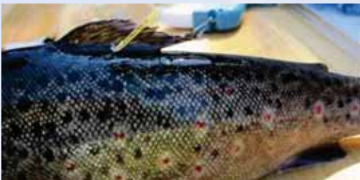
Ankkurimerkillä merkitty taimen

Päijänteen vesistössä merkitään taimenia T-ankkurimerkein. Merkinnöillä seurataan taimenten vaellusta ja kannan tilaa. Merkistä kirjoitetaan ylös koodi. Liitä koodin tiedot, kuten pyyntipaikka, paino ja pituus. Koodit voi lähettää postimaksutta osoitteeseen: RKTLL, Merkit, 5005751, 00003 VASTAUSLÄHETYS Lisäohjeita saat internetistä osoitteesta http://www.rktl.fi/kala/kalavarat/kalamerkinta/