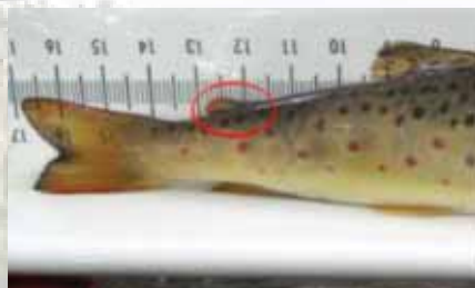
Rasvaevällinen taimen (luonnonkala)