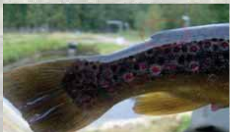
Eväleikattu taimen (istukas)

Vuoden 2016 alusta on rasvaevällinen taimen kalastusasetuksella rauhoitettu leveyspiirin 64 eteläpuolella. Sääntö koskee siis myös Päijänteen vesistöä.