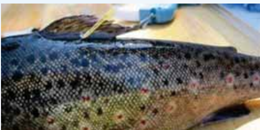
Ankkurimerkillä merkitty taimen

Päijänteen vesistössä merkitään taimenia T-ankkurimerkein. Merkinöillä seurataan taimenten vaellusta ja kannan tilaa. Merkistä kirjoitetaan ylös koodi. Liitä koodin tiedot, kuten pyyntipaikka, paino ja pituus. Koodit voi lähettää postimaksutta osoitteeseen: RKTLL, Merkit, 5005751, 00003 VASTAUSLÄHETYS Lisäohjeita saat internetistä osoitteesta http://www.rktl.fi/kala/kalavarat/kalamerkinta/