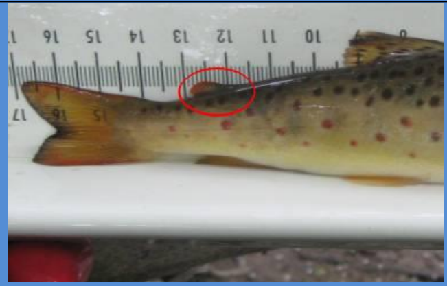
Rasvaevällinen luonnonkala