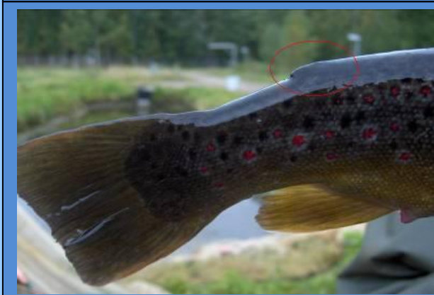
Eväleikattu istukastaimen

Vuoden 2016 alusta alkaen on rasvaevällinen taimen kalastusasetuksella rauhoitettu leveyspiirin 64 eteläpuolella. Sääntö koskee siis myös Päijänteen vesistöä.