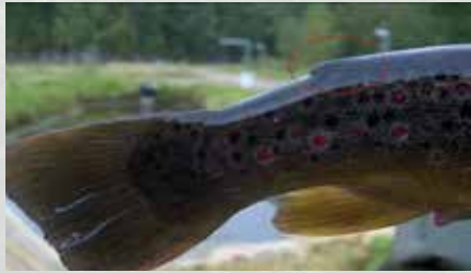
Eväleikattu taimen (istukas)

Vuoden 2016 alusta on rasvaevällinen taimen kalastusasetuksella rauhoitettu leveyspiirin 64 eteläpuolella. Sääntö koskee siis myös Päijänteen vesistöä.