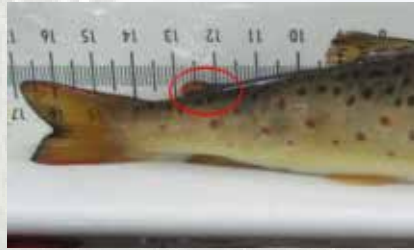
Rasvaevällinen taimen (luonnonkala)