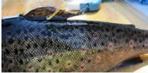
Ankkurimerkillä merkitty taimen

Päijänteen vesistössä merkitään taimenia T-ankkurimerkein. Merkinnoilla seurataan taimenten vaellusta ja kannan tilaa. Merkistä kirjoitetaan ylös koodi. Liitä koodin tiedot, kuten pyyntipaikka, paino ja pituus. Koodit voi lähettää postimaksutta osoitteeseen: LUKE, Merki, 5005751, 00003 VASTAUSLÄHETYS Lisäohjeita saat internetistä osoitteesta https://lomakkeet.luke.fi/kalamerkki