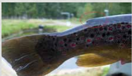
Eväleikattu taimen (istukas)

Vuoden 2016 alusta on rasvaevällinen taimen kalastusasetuksella rauhoitettu leveyspiirin 64 eteläpuolella. Sääntö koskee siis myös Päijänteen vesistöä.