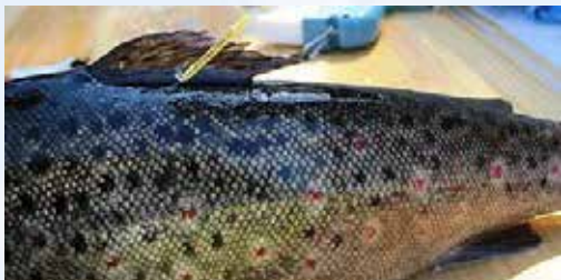
Ankkurimerkillä merkitty taimen

Päijänteen vesistössä merkitään taimenia T-ankkurimerkein. Merkinnoilla seurataan taimenten vaellusta ja kannan tilaa. Merkistä kirjoitetaan ylös koodi. Liitä koodin tiedot, kuten pyyntipaikka, paino ja pituus. Koodit voi lähettää postimaksutta osoitteeseen: LUKE, Merki, 5005751, 00003 VASTAUSLÄHETYS Lisäohjeita saat internetistä osoitteesta https://lomakkeet.luke.fi/kalamerkki