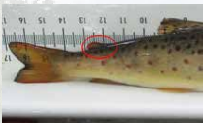
Rasvaevällinen taimen (luonnonkala)